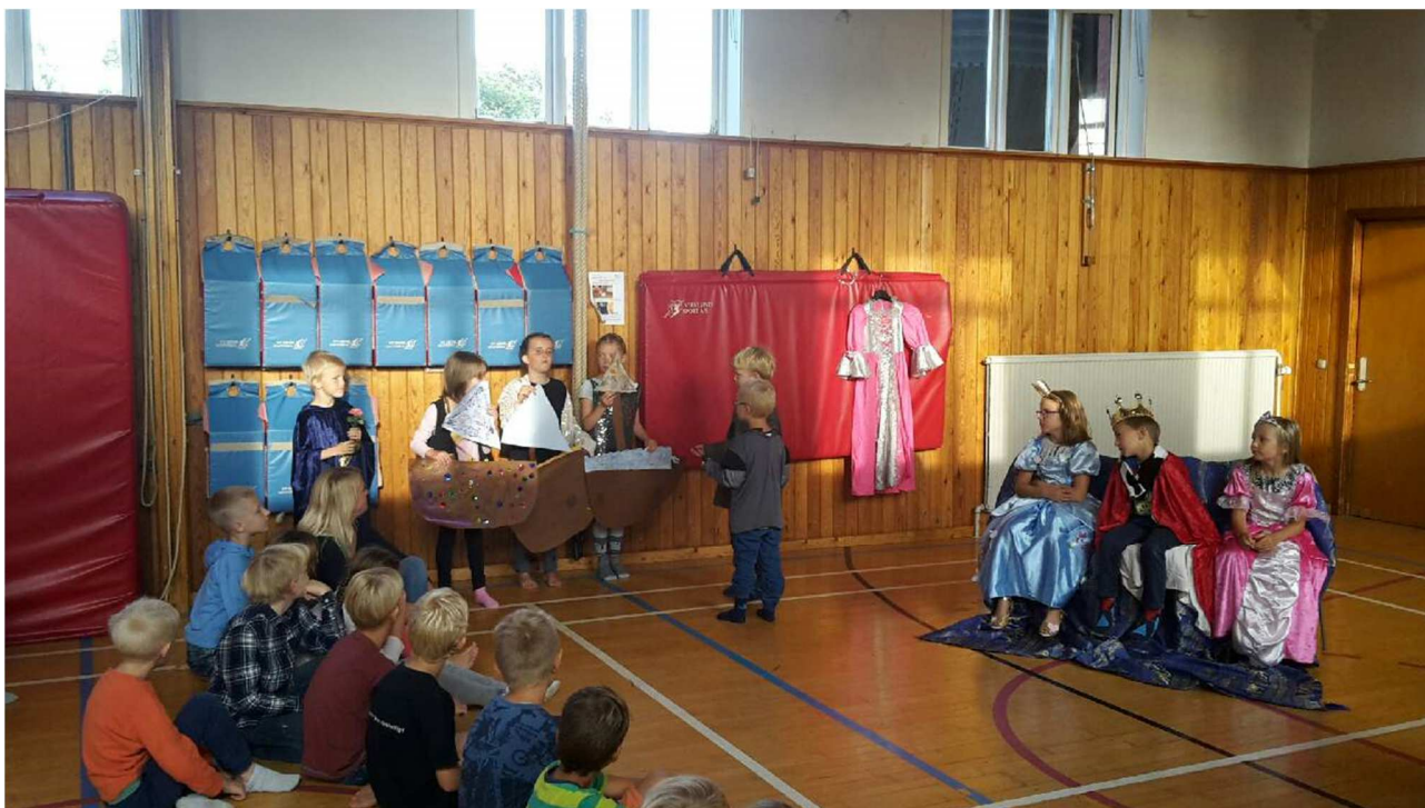
Det er helt naturligt at vise og dele det man selv har lært til morgensamling og for alle kammeraterne på Sydbornholms.

Morgensangens fællesskab er uvurderligt.